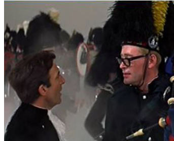
1966 CASINO ROYALE (Casino Royale) de John Huston, Ken Hughes avec Peter Sellers