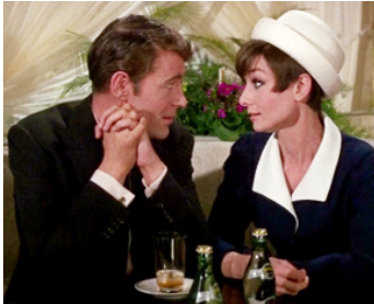
1965 COMMENT VOLER UN MILLION DE DOLLARS de William Wyler avec Audrey Hepburn