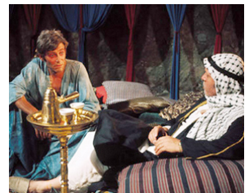
1974 ROSEBUD (Rosebud) d'Otto Preminger avec Richard Attenborough