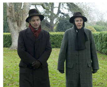
2007 DEAN SPANLEY (My talks with Dean Spanley) de Toa Fraser avec Jeremy Northam