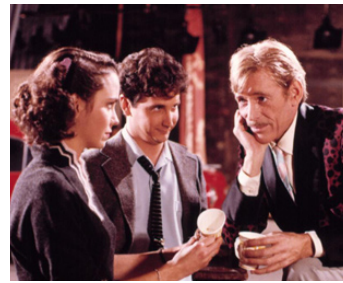
1982 OÙ EST PASSÉ MON IDOLE ? (My favorite Year) de R. Benjamin avec J. Harper, M. Linn Baker