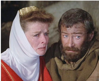
1968 LE LION EN HIVER (The Lion in Winter) d'Anthony Harvey avec Katharine Hepburn