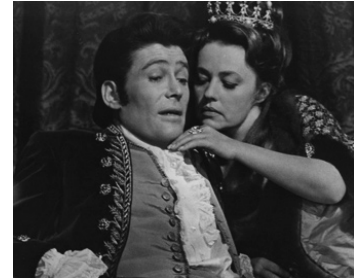
1967 LA GRANDE CATHERINE (Great Catherine) de Gordon Flemyng avec Jeanne Moreau