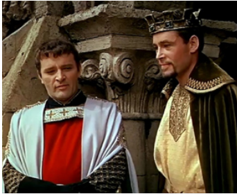
1963 BECKET (Becket) de Peter Glenville avec Richard Burton