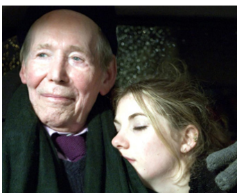
2006 VÉNUM (Venus) de Roger Michell avec Jodie Whitaker