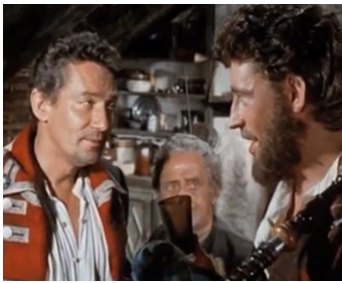
1959 L'ENLÈVEMENT DE DAVID BALFOUR (Kidnapped) de Robert Stevenson avec P. Finch