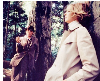
1969 COUNTRY DANCE (Brotherly Love) de Jack Lee Thompson avec Susannah York