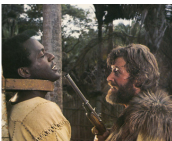
1974 L'ÎLE DU MAÎTRE (Man Friday) de Jack Gold avec Richard Rountree