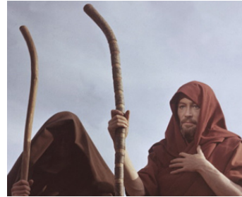
1964 LA BIBLE (The Bible: in the Beginning) de John Huston