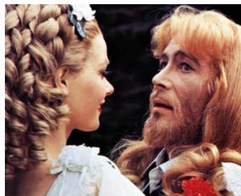
1971 DIEU EST MON DROIT (The ruling Class) de Peter Medak avec Carolyn Seymour