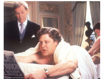
1990 RALPH SUPER KING (King Ralph) de David S. Ward avec John Goodman