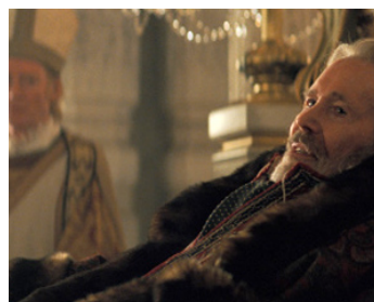
2007 STARDUST, LE MYSTÈRE DE L'ÉTOILE (Stardust) de M. Vaughn avec Struar Rodgers