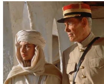
1990 ISABELLE EBERHARDT d'Ian Pringle avec Mathilda May