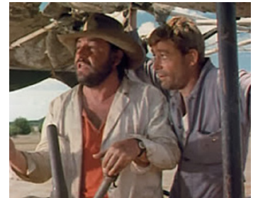
1970 LA GUERRE DE MURPHY (Murphy's War) de Peter Yates avec Philippe Noiret