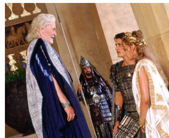
2003 TROIE (Troy) de Wolfgang Petersen avec Orlando Bloom, Diane Kruger