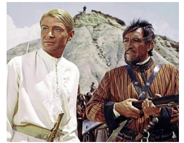
1962 LAWRENCE D'ARABIE (Lawrence of Arabia) de David Lean avec Anthony Quinn