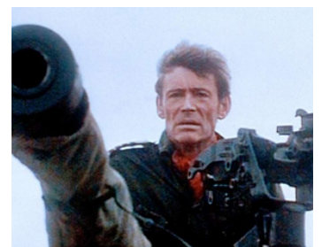
1978 LE JEU DE LA PUISSANCE (Power Play) de Martyn Burke