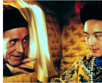
1987 LE DERNIER EMPEREUR (The last Emperor) de Bernardo Bertolucci avec Tao Wu