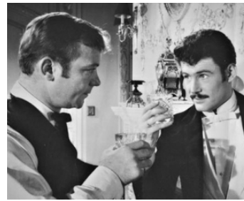
1960 THE DAY THEY ROBBED THE BANK OF ENGLAND de J. Guillermin avec Aldo Ray