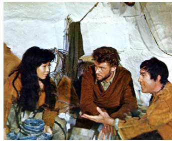
1959 LES DENTS DU DIABLE (The Savage Innocents) de N. Ray avec Yoko Tani, A. Quinn