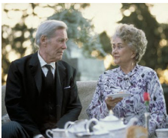
2001 AU CŒUR DU ROCK (Global Heresy) de Sidney J. Furie avec Joan Plowright