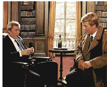
1989 PAR UNE NUIT DE CLAIR DE LUNE (In a notte...) de Lina Wertmüller avec Rutger Hauer