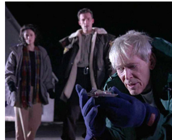
1996 PHANTOMS (Dean Koontz's Phantoms) de Joe Chappelle avec Rose McGowan, Ben Affleck