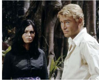
1963 LORD JIM (Lord Jim) de Richard Brooks avec Dahlia Lavi