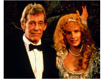
1988 HIGH SPIRITS (High Spirits) de Neil Jordan avec Daryl Hannah