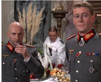
1966 LA NUIT DES GÉNÉRAUX (The Night of the Generals) d'Anatole Litvak avec D. Pleasence