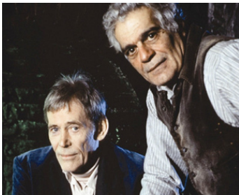
1991 LE VOLEUR D'ARC-EN-CIEL (The Rainbow Thief) d'A. Jodorowski avec Omar Sharif