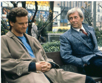
1988 LES AILES DE LA RENOMMÉE (Wings of Fame) d'Otokar Votocek avec Colin Firth