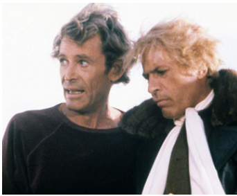
1978 LE DIABLE EN BOÎTE (The Stunt Man) de Richard Rush avec Adam Roarke