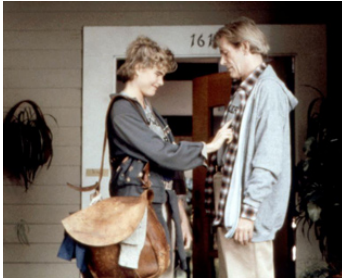
1985 CREATOR (The big Picture) d'Ivan Passer avec Mariel Hemingway