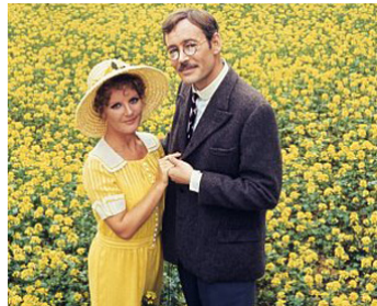
1969 AU-REVOIR, MONSIEUR CHIPS (Goodbye, Mr Chips) d'Herbert Ross avec Petula Clark