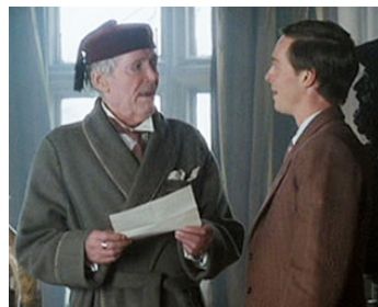
2003 BRIGHT YOUNG THINGS de Stephen Fry avec Stephen Campbell