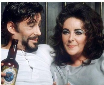
1971 AU BOIS LACTÉ (Under the Milk Wood) d'Andrew Sinclair avec Elizabeth Taylor