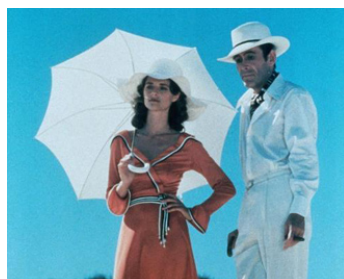
1975 FOXTROT (The far side of Paradise) d'Arturo Ripstein avec Charlotte Rampling