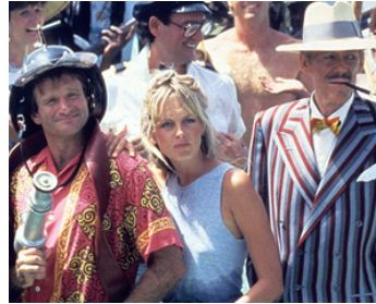
1986 CLUB PARADIS (Club Paradise) d'Harold Ramis avec Robin Williams, Twiggy