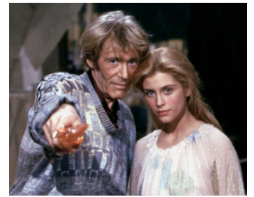
1984 SUPERGIRL (Supergirl, the Movie) de Jeannot Szwarc avec Helen Slater