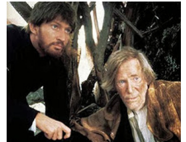
1998 MOLOKAI (The Story of Father Damien) de Paul Cox avec David Wenham