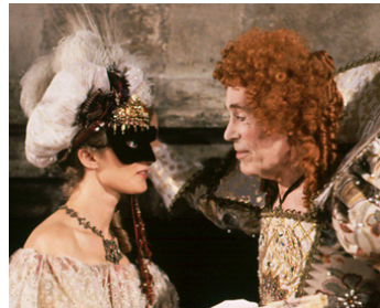
1992 REBECCA'S DAUGHTERS de Karl Francis avec Sue Roderick