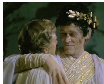
1976 CALIGULA (Caligula) de Tinto Brass avec Malcolm McDowell