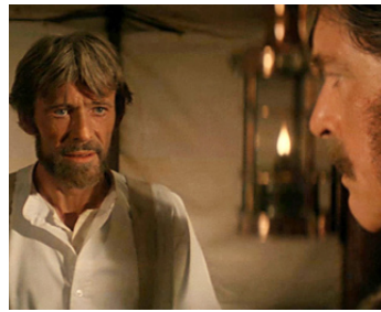
1979 L'ULTIME ATTAQUE (Zulu Dawn) de Douglas Hickox avec Burt Lancaster