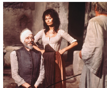
1972 L'HOMME DE LA MANCHA (Man of La Mancha) d'Arthur Hiller avec Sophia Loren